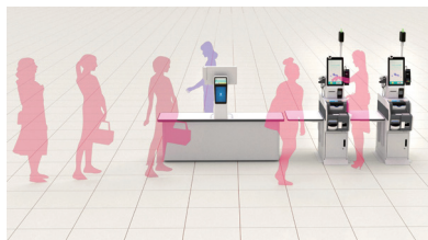
店員が商品登録し、買物客が精算を行う セミセルフレジ「スピードセルフ」イメージ図